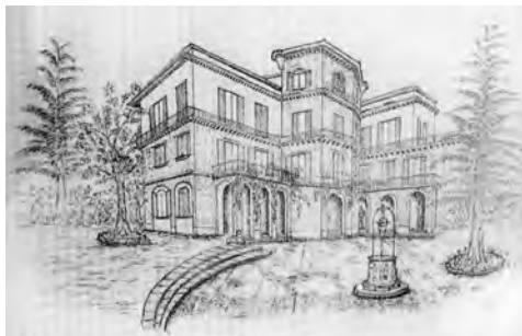
Cava de' Tirreni, 1944. Bozzetto di Villa Ricciardi, residenza di Badoglio durante il governo di Salerno.

Ma Mussolini rispose che la situazione che si era venuta a determinare dopo gli ultimi avvenimenti esigeva l'intervento immediato dell'Italia. «Nel settembre tutto sarà finito», e ancora, «Ho bisogno solo di qualche migliaio di morti, che saprò far pesare al tavolo della pace». Ecco le sue precise parole.