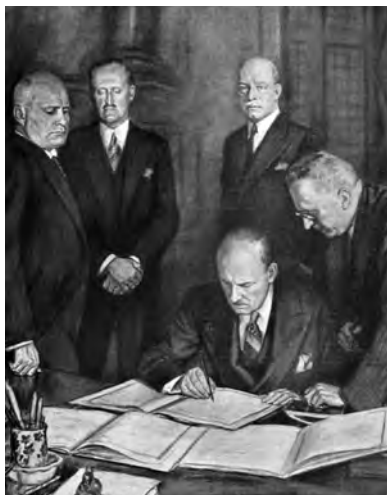
7 giugno 1933. Gli ambasciatori von Hassell (Germania), De Jouvenel (Francia) e Graham (Inghilterra) sottoscrivono, alla presenza di Mussolini, il Patto a quattro, che non verrà però ratificato dai rispettivi governi (stampa tratta dalla rivista "L'Illustration").

ni all'ostracismo o all'esilio. Alcuni, come Amendola e Matteotti, ci lasciarono la vita.