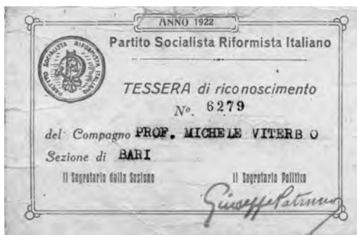
1922, tessera d'iscrizione al Partito Socialista Riformista.

decreto firmato dal Re e affissi in via delle Terme di Diocleziano e in piazza San Bernardo. Non v'era nemmeno molta gente che si fermasse a leggerli e nessuno li commentava ad alta voce: il decreto, a Roma, era accolto con indifferenza. Poi si seppe che il Re non lo aveva firmato e il povero Facta, che era già dimissionario e che avrebbe voluto tentare una resistenza con lo stato d'assedio, fu sostituito con Mussolini da Vittorio Emanuele e divenne il capro espiatorio della situazione.