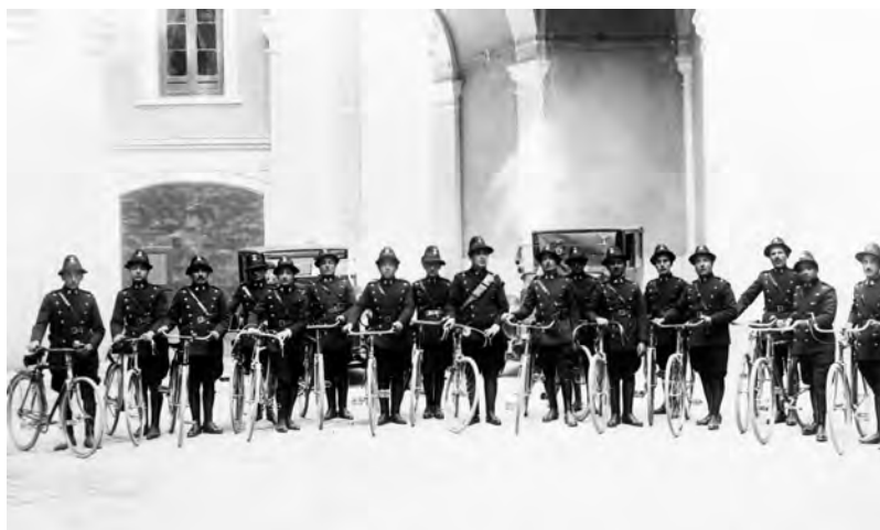
Ottobre 1927. Il Corpo di vigilanza stradale in bicicletta, istituito, primo in Italia, dalla Provincia di Bari.