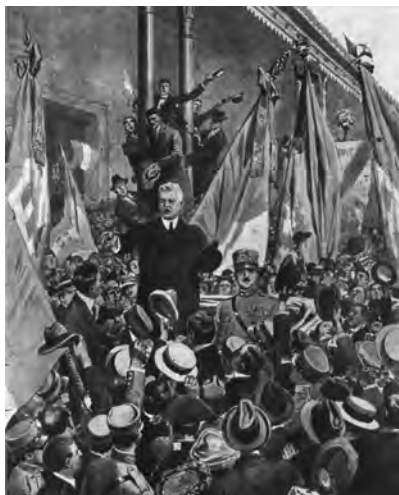
Roma, maggio 1919. Sommerso dalla folla, al suo ritorno da Versailles, Vittorio Emanuele Orlando denuncia alla Stazione di Roma la condotta degli alleati nei nostri confronti. Tavola di Beltrame per "La Domenica del Corriere".

sconfitta militare sia stata fatta pesare, senza distinzione, su tutto un partito di milioni di persone.