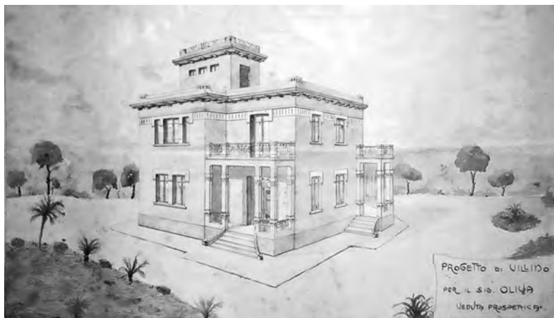
1943-1944. La residenza di Badoglio, a Brindisi, in un vecchio disegno fornito dai proprietari.