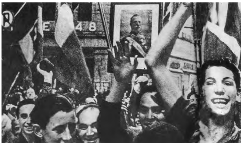
Roma, 26 luglio 1943. Manifestazioni di esultanza alla caduta della dittatura fascista.

to, lui ad aggregarsi di volta in volta alla Germania e a sottomettersi alla sua politica fallimentare. Più giorni passano, più le responsabilità di Mussolini appaiono nella loro vera luce. Inutile da parte nostra, fascisti, tentare di giustificarlo. I fatti parlano chiaro e a noi non resta che il cocente rimprovero di averlo seguito con tanta fede o meglio con tanta buona fede.