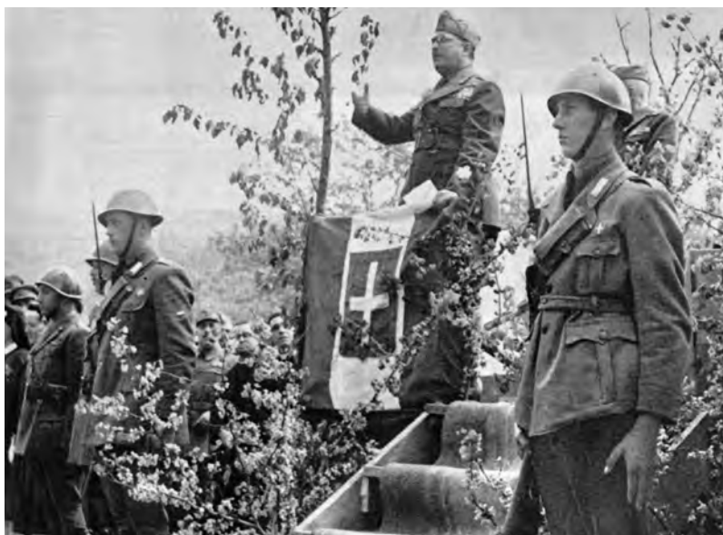
Maggio 1944. Il generale Taddeo Orlando, ministro della Guerra, parla ai soldati del Corpo italiano di liberazione.

che, illusi dalla propaganda fascista, aggravano ancor più, con la lotta fratricida, lo scempio di questa sciagurata guerra! «Molti di loro – ha continuato il generale – hanno scelto di seguire Mussolini contro il proprio interesse, pur sapendo che egli è perdente e votato ormai alla sconfitta». Io gli ho fatto notare che, se non ci fosse stata la Repubblica di Mussolini, gli italiani avrebbero quasi tutti combattuto contro i tedeschi. Non ci sarebbero stati questi orribili eccidi, e avremmo avuto una guerra di riscatto nazionale, che avrebbe risvegliato il sentimento patriottico del popolo.