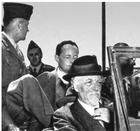
Ivanoe Bonomi su una jeep americana.

Bonomi ha settant'anni ed è indubbiamente una nobile figura. Sotto il regime fascista lo si incontrava spesso volte a Roma, molto dimesso nel vestire, alquanto malandato in salute. Si sapeva che viveva modestissimamente in Piazza della Libertà. Durante questi anni ha scritto due libri notevoli, uno sulla Repubblica Romana del 1849 e l'altro su Leonida Bissolati, del quale fu amico e collaboratore. Avrà l'energia necessaria per reggere il timone in un'ora eccezionale come questa? Egli ha avuto, oltre la presidenza, i Ministeri degli Interni e degli Esteri ed è intenzionato a fare sul serio la guerra