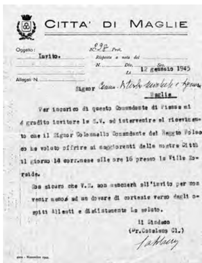
1945. L'invito al ricevimento con il quale il Reggimento polacco si congedava da Maglie.

Mi chiedo, però, se veramente Churchill e Roosevelt abbiano per un solo momento pensato, mentre lanciavano il loro verbo, al significato del vocabolo "sovietizzazione" (che ha molti punti in comune