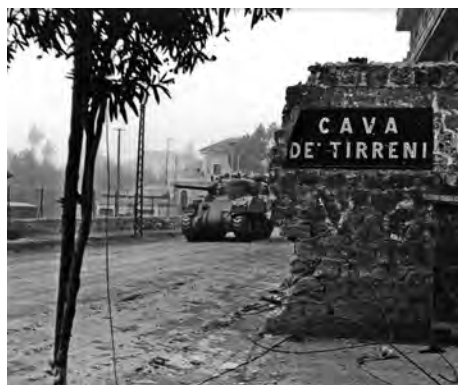
1944, Cava de' Tirreni. Uno Sherman della Quinta Armata americana.

Il Maresciallo è fresco e sereno. Gli parlo come prima cosa delle nostre navi da guerra e del successo da lui conseguito nei riguardi degli alleati, i quali per ora lasciano sotto la nostra sovranità alcune