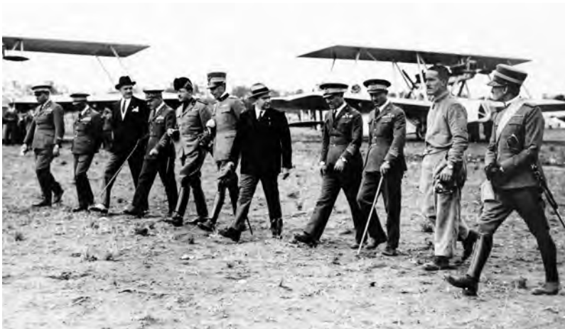
Bari, 12 ottobre 1930. Inaugurazione del Campo d'Aviazione di Palese.