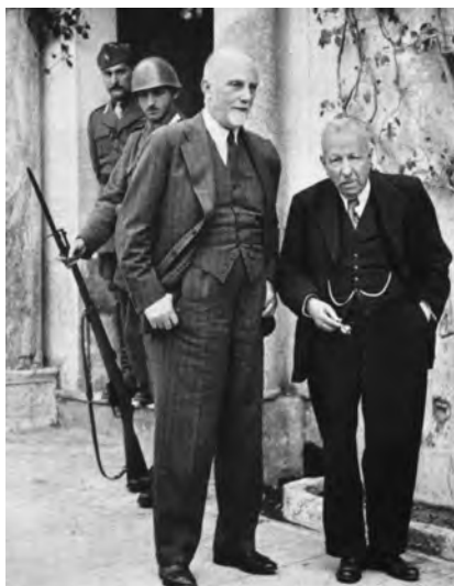
1944, Ravello. I ministri Carlo Sforza e Benedetto Croce a Villa Episcopo.

Circa gli attuali partiti mi par di capire che il meglio organizzato è, secondo il Maresciallo, la Democrazia Cristiana. Cerco poi di sa-