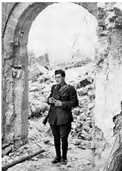
Febbraio-maggio 1944. Una sentinella italiana monta la guardia tra le rovine di Montecassino.

nizzare meglio la loro difesa i tedeschi infatti ora si rifugiano tra le macerie e riescono così a ritardare l'avanzata degli anglo-americani, che hanno mandato a combattere, avanti a loro, reparti polacchi.