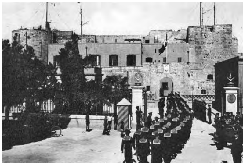
1943-1944. Il Castello di Brindisi, sede degli uffici di Badoglio.

Successivamente Badoglio ha ricordato le varie vicende della giornata del 25 luglio. Quando Mussolini si accorse che il Re aveva preso la sua decisione e aveva già accettato le dimissioni che il Duce non gli aveva peraltro dato, si accasciò su una sedia e disse: «Ma questo è il mio crollo!». Come se non ci fosse già stato il crollo dell'Italia intera, commentai io ad alta voce. Dalla caserma ove poi fu rinchiuso per sottrarlo all'ira popolare che, specie in quei primi momenti, era violentissima, Mussolini scrisse a Badoglio una lettera di ringraziamento mettendosi a sua completa disposizione.