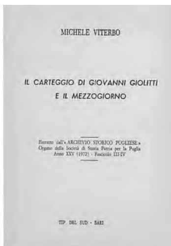
Le due monografie su Sidney Sonnino e Giovanni Giolitti sono del 1923 e del 1972.