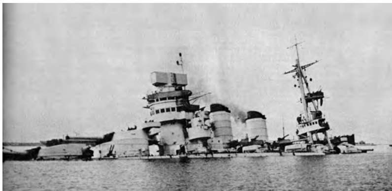
Taranto, 11 novembre 1940. La corazzata "Cavour" dopo l'attacco inglese.

La notte tra l'11 e il 12 novembre del '40 gli inglesi bombardarono Taranto, e le più grosse navi da battaglia, la "Cavour" in testa, subirono danni gravissimi. La flotta, il vanto dell'Italia, non era riu-