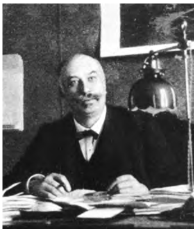
L'onorevole Giovanni Giolitti.

Molti adesso asseriscono che Giolitti fosse uomo ben capace di tentare di legalizzare il fascismo e all'occorrenza di fronteggiarlo; ma sono congetture. Certo è che, sino al delitto Matteotti, Giolitti si dichiarò ministeriale e presiedette nel 1923 la Commissione per la riforma elettorale. Qualcuno osservò che nessuno come il «ministro della malavita» poteva assumersi la responsabilità di propugnare il varo della riforma che legalizzava la conquista fascista, consegnando l'Italia a Mussolini, purché fosse riuscito ad assicurarsi, con tutti i mezzi, il 25% dei voti!