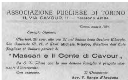
L'invito alla Conferenza su Giuseppe Massari, a Torino, ricordata a pag. 224.