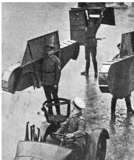
Una foto del 1919 ritrae i soldati tedeschi mentre si addestrano con le sagome dei carri armati in legno montate su veicoli civili.

È opportuno nondimeno ricordare che contribuirono alla ripresa economica della Germania anche le eccezionali capacità di lavoro e di organizzazione del suo popolo, dimostratesi ancora più combattive di quelle messe in pratica prima della sconfitta, oltre alla voca-