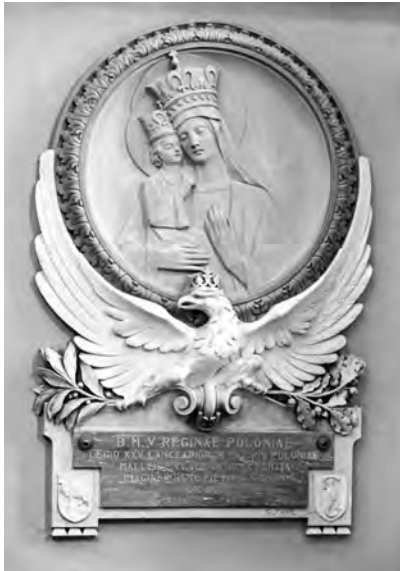
Il medaglione, opera di Giuseppe Conte, donato dal 25° Reggimento polacco alla chiesa Madre di Maglie.

be, anche sotto questo punto di vista, schiacciante. Ma siffatto piano tedesco contro l'Egitto esisteva per davvero? Da quali porti sarebbero partiti i tedeschi? E comunque perché non fecero scendere noi in Tunisia sin dal giugno del '40 e come mai, occupata la Grecia e Creta, e col Dodecanneso in nostre mani, non tentarono la conquista di Malta o l'azione contro l'Egitto e il Medio Oriente, che avrebbe potuto essere risolutiva, invece di attaccare la Russia?