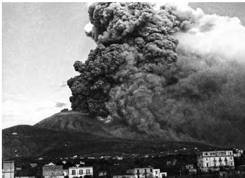
Marzo 1944. L'eruzione del Vesuvio.

unità navali con il compito di agire in concorso con le truppe operanti e rimandano alla fine della guerra ogni decisione su come sarà divisa la flotta tra i vincitori. Badoglio conferma che, dopo il suo determinato intervento, un terzo delle nostre navi che, come Roosevelt aveva anticipato, era destinato ai russi affinché continuasse a combattere nel Mediterraneo sotto la loro bandiera e con loro equipaggi, non sarà più consegnato ai sovietici. Il Maresciallo afferma che i suoi sforzi per poter riavere qualche nave da guerra già precedentemente internata sono stati «ostacolati con tenacia» dagli americani e anche dagli inglesi. Gli uni e gli altri hanno però fatto macchina indietro quando hanno capito, rivela il Maresciallo, «che Badoglio avrebbe potuto dare l'ordine agli equipaggi di affondare le nostre navi oppure di far saltare in aria la piazzaforte di Taranto».