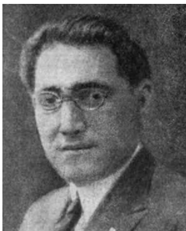
L'onorevole Luigi Razza.

Razza era uomo di popolo, il sindacalista rivoluzionario di un tempo, che intendeva la rivoluzione come organica costruzione quotidiana, come lievito fecondatore, come dinamismo in azione. Era rimasto un ribelle perché credeva anzitutto nella incoercibile virtù del popolo italiano e simboleggiava l'audacia volitiva e la capacità di sacrificio degli italiani.