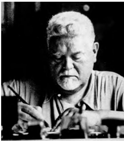
Giovanni Gentile al lavoro nel suo studio.