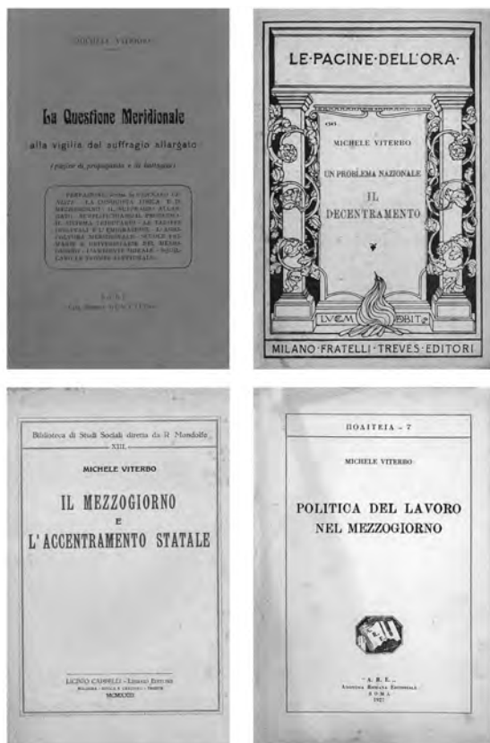
La questione meridionale e il decentramento negli scritti di Michele Viterbo.

Questa ripetizione di vecchi motivi è però sconsolante. Si torna indietro, come se i decenni siano trascorsi invano. A me pare che, nell’attuale momento, il problema sia posto male. Se gli impianti industriali del Nord si salveranno, il problema meridionale sussisterà supergiù nelle identiche condizioni di venti o trent’anni addietro; ma se, per nostra dannazione, quegli impianti saranno distrutti, le cose muteranno completamente.