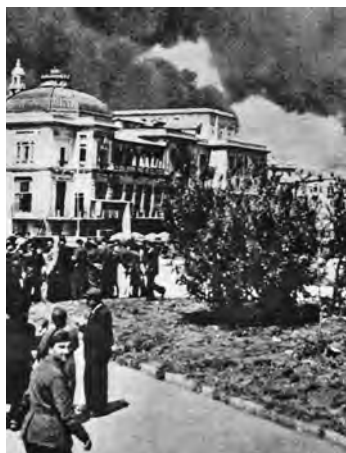
2 dicembre 1943. Il porto di Bari è bombardato dai tedeschi.

Convegno a Teheran tra Roosevelt, Churchill e Stalin. È notorio che il loro accordo è solo apparente. La Russia progetterebbe di ascrivere la Germania pretendendo da essa, si dice, il pagamento di cento milioni di sterline, il che vorrebbe dire in sostanza l'aggiogamento della Germania alla Russia e la graduale bolscevizzazione dei