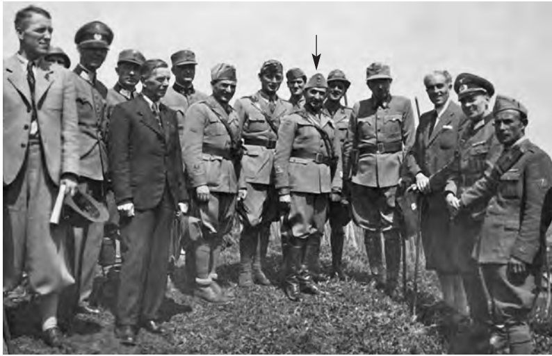
Maggio 1942. La Commissione per lo studio del confine italo-tedesco-croato. La delegazione italiana è guidata dal colonnello Ferdinando Viterbo (indicato dalla freccia), che sarà promosso generale prima della fine della guerra.

Non avevo molta simpatia per i tedeschi e non mi piaceva che essi primeggiassero nell'alleanza con noi. Un'alleanza ha il suo valore quando è fatta tra eguali e con criteri di uguaglianza, non tra forti e deboli (eterna attualità di Machiavelli). Purtroppo ciò che venivo a sapere dai soldati delle campagne di Grecia, penisola balcanica, Africa e Russia avvalorava i miei dubbi e acuiava la mia intima angoscia.