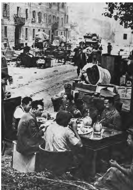
Milano, il ritorno alla normalità, tra le macerie, dopo un bombardamento alleato.

Ma a queste ormai superflue considerazioni bisognerebbe aggiungere che, dopo due guerre mondiali vinte, gli americani non sono ancora in grado di immaginare una differente concezione sociale o di promuovere un'esperienza economica che non abbia come modello la bassa speculazione, la sete di subiti guadagni, il forsennato gioco dei mercati monetari. Insomma, l'oscuro, approfittatore capitalismo.