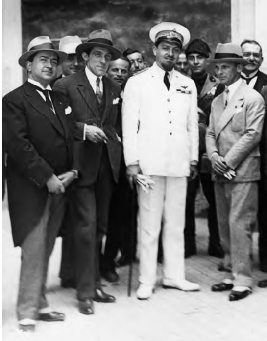
Italo Balbo (in divisa al centro della foto; a sinistra Michele Viterbo e Araldo di Crollalanza; a destra il prefetto Umberto Albini) a Bari, il 2 giugno 1929, quando si decise di realizzare il Campo d'Aviazione. Nell'articolo de "La Gazzetta del Mezzogiorno" del 6 aprile 1960, citato prima, Michele Viterbo ricorda che il Campo fu allestito dalla Provincia in un solo anno, «col che egli vinse un'amichevole scommessa con Italo Balbo».