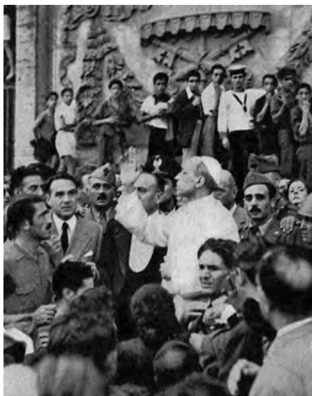
Roma, 13 agosto 1943. Davanti alla Basilica di San Giovanni, Pio XII benedice e incoraggia la folla, dopo il secondo bombardamento della capitale da parte degli alleati.

Il sottosegretario agli Esteri Visconti Venosta, richiesto in merito d’una sua impressione, si è domandato a tal riguardo: «Perché non piuttosto Commissione di collaborazione o di cooperazione?». O Dio! La risposta è semplice e il sottosegretario lo sa bene: perché ammetterci a collaborare vorrebbe dire riconoscerci una certa tal quale funzione di grande o media potenza, e questo, appunto, gli anglo-americani non vogliono consentirci.