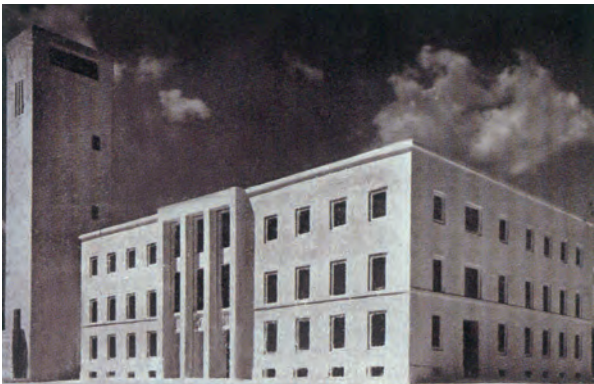
L'ex Casa del Fascio di Lecce, divenuta sede provvisoria del Ministero della Guerra (da “Puglia in linea”, 1939).

Per la relativa conoscenza che ne ho avuto, devo però dire che il principe e la principessa di Piemonte sono persone che non hanno nulla da invidiare ad altre coppie regnanti, anzi, per alcuni versi, sono anche migliori. La principessa, che durante il periodo bellico ho accompagnato nelle sue visite in ospedali e in convalescenziari di Bari e provincia, ha svolto un’opera ammirevole. È molto colta, si rende conto di tutto, è spregiudicata e non ha mai dimostrato simpatie per il regime. Il bel principe Umberto è sorridente con tutti, forse troppo sorridente. Teme molto, e si vede, l’autorità paterna, ma ciò è una malattia di famiglia: accadeva a Umberto I con Vittorio Emanuele II, a quest’ultimo con Carlo Alberto e, all’attuale, con Umberto I.