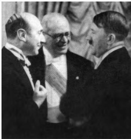
Adolf Hitler con l'ambasciatore Bernardo Attolico (al centro) e il consigliere d'ambasciata Massimo Magistrati.

Dei gerarchi russi descrisse i tanti pantagruelici banchetti, mentre il popolo moriva letteralmente di fame, gli innumerevoli brindisi con finale rottura di bicchieri, la gioia dei componenti le due delegazioni per lo scampato pericolo, quando, la notte tra il 23 e il 24 agosto del '39, fu firmato tra Russia e Germania il Patto di non aggressione, che conteneva tra l'altro l'assicurazione sovietica di non schierarsi con Francia e Inghilterra, qualora queste avessero mosso guerra alla Germania. Alcuni di questi particolari la contessa li aveva appresi direttamente dall'ambasciata italiana a Mosca.