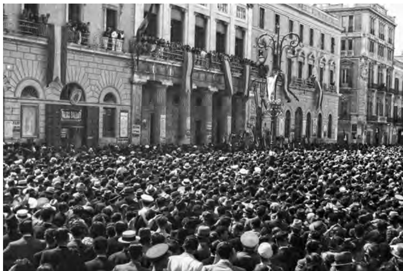
Il Maresciallo Pietro Badoglio parla a Bari nel settembre 1936.

Durante il viaggio si parlò di tante cose con lui e con le persone del seguito e mi accorsi subito che il Maresciallo sorrideva con filosofia alle facezie antifasciste dei suoi accompagnatori. D'altronde, taluni ultimi fatti si prestavano alla più amara ironia, come per esempio il mutamento del nome del vecchio scalo albanese di Santi Quaranta in Porto Edda, in omaggio alla figlia del Duce, o di piazza Cavour a Firenze in piazza Costanzo Ciano.